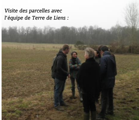
Visite des parcelles avec l'équipe de Terre de Liens :

Nous sommes décidés à concrétiser ce projet, mais nous ne pouvons pas supporter seuls le poids financier que représente l'acquisition des terres. Plutôt que de nous endetter pour la majeure partie de notre vie, nous nous sommes tournés vers un achat collectif via la Foncière Terre de Liens*. En outre celle-ci facilitera la transmission de notre ferme après nous, et garantira la préservation de ces terres qui resteront dédiées à une agriculture biologique et paysanne à travers les générations.